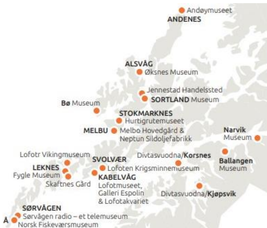
Figur 3: Kart over 21 besøkssteder i Museum Nord.

Museum Nord har fire avdelinger med 21 besøkssteder: