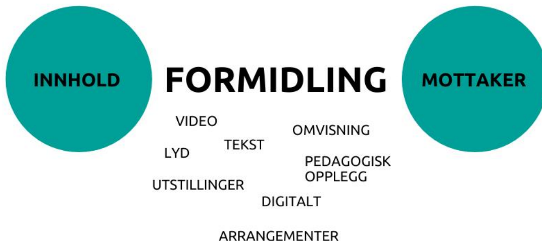
Figur 1: Formidling er bindeleddet: vi bruker ulike metoder for å formidle innholdet til mottakeren.

Det digitale rommet åpner for å kombinere formidlingsmetoder gjennom AR, VR, apper, podkast, sosiale media, nettsider og digitale arrangementer.